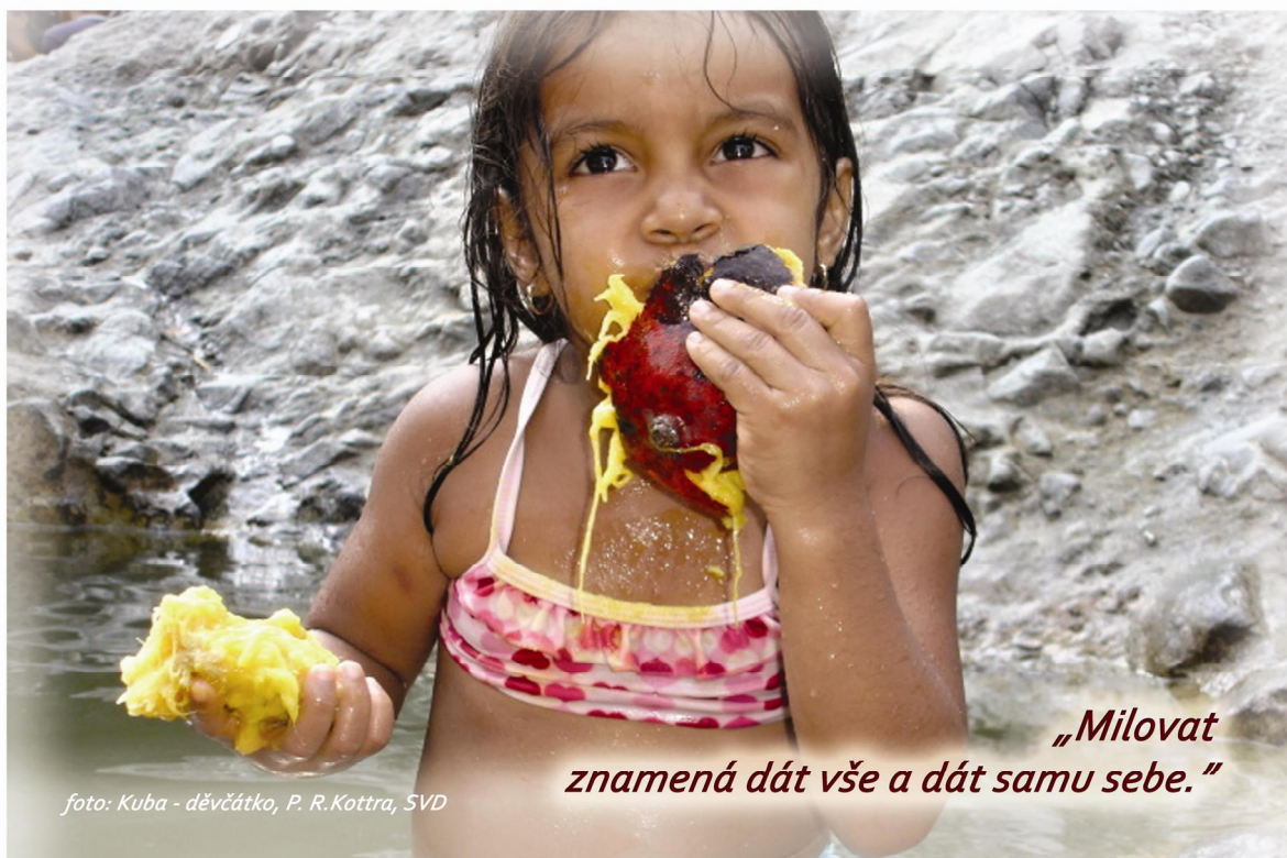
foto: Kuba - děvčátko

21 So Alois 22 Ne Pavla 23 Po Zdeňka 24 Út Sv. Jana Křtitele; Jan 25 St Ivan 26 Čt Adriana 27 Pá Nejsvětější srdce Ježíšovo; Ladislav 28 So Neposkvrněné srdce Panny Marie; Lubomír 29 Ne Sv. Petra a Pavla; Petr a Pavel 30 Po Šárka