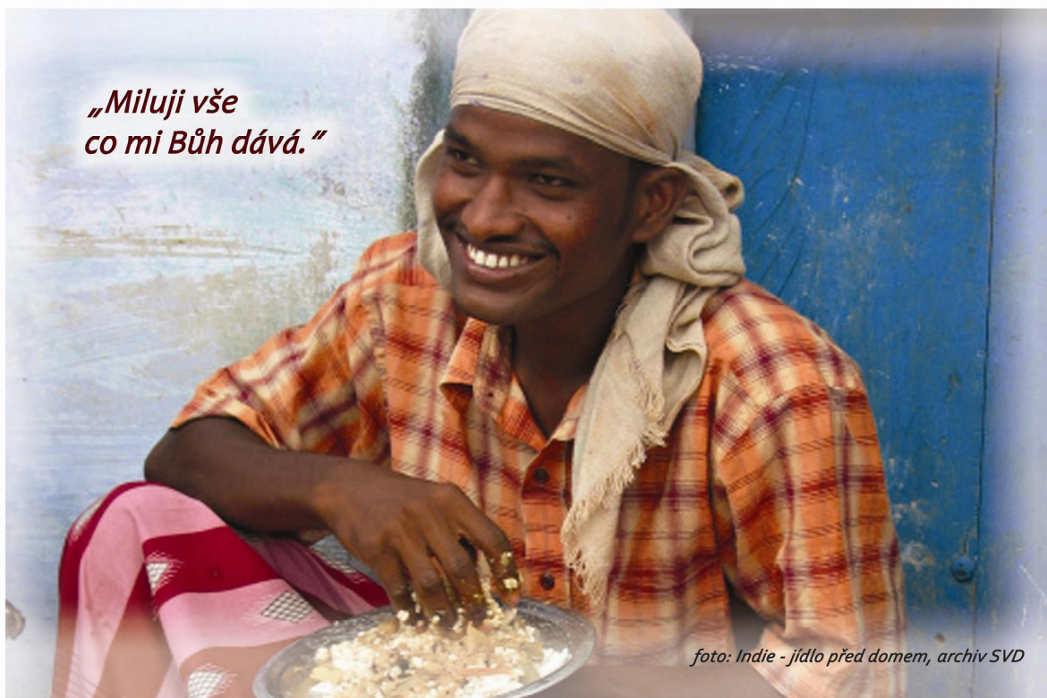
foto: Indie - jídlo před domem